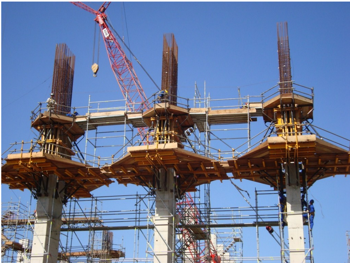
Vista Geral da Obra – Itaguaí-RJ

A mais nova obra da MARINHA do Brasil, o Estaleiro e Base de Submarinos que está sendo construído em Itaguaí-RJ, com um canteiro de obras com mais de 90 mil metros quadrados, e construção sob responsabilidade da Odebrecht, o projeto também contempla, construir uma unidade de fabricação de estrutura metálica (UFEM), onde serão construídas as partes internas dos submarinos.